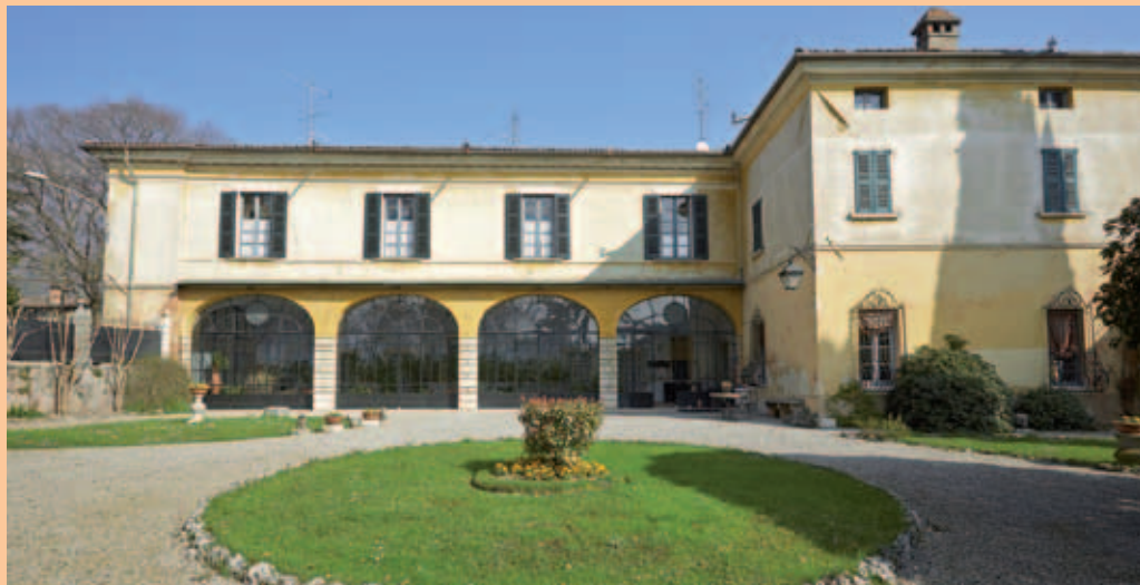
Villa Bordoni - lato sud

Verso l'interno l'edificio racchiude diversi spazi aperti: il giardino principale, su cui si apre il portico, è di circa 1500 mq. Vi sono poi il giardino tergaie dedicato all'azienda agricola e i campi agricoli aperti verso est. Solo dal giardino è possibile scorgere nella sua interezza la facciata principale, di due piani. Gli archi schiacciati del portico caratterizzano la parte basamentale, mentre il piano nobile, semplicemente intonato, è interrotto da quattro grandi finestre poste al centro e concluso dall'elegante cornicione.