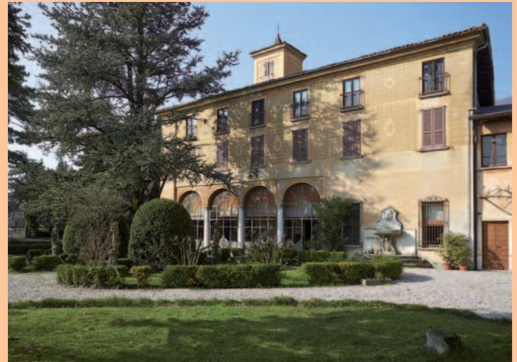
Villa Elide - fronte sud