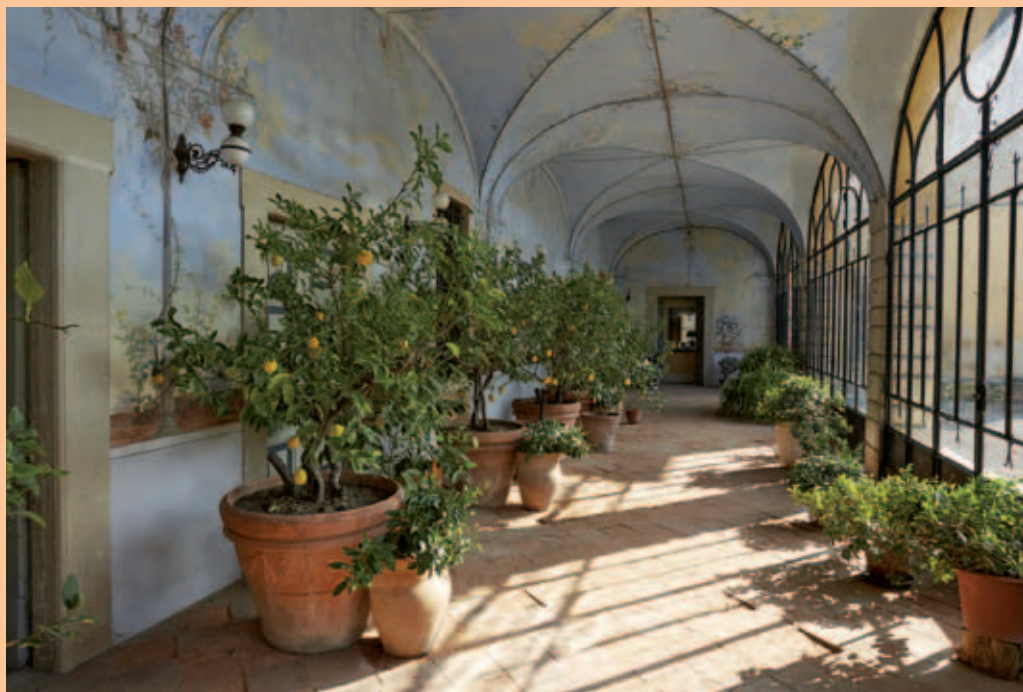
Villa Bordoni - particolare della veranda