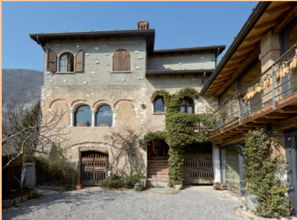
Casa Marchetti - Nicoli - fabbricati che si affacciano sul cortile interno

Ancora oggi è una testimonianza di religiosità, di storia, di architettura: la sua bellezza ci affascina; è un patrimonio artistico e culturale per i proprietari, per S. Gallo, per Botticino e per la Valverde.