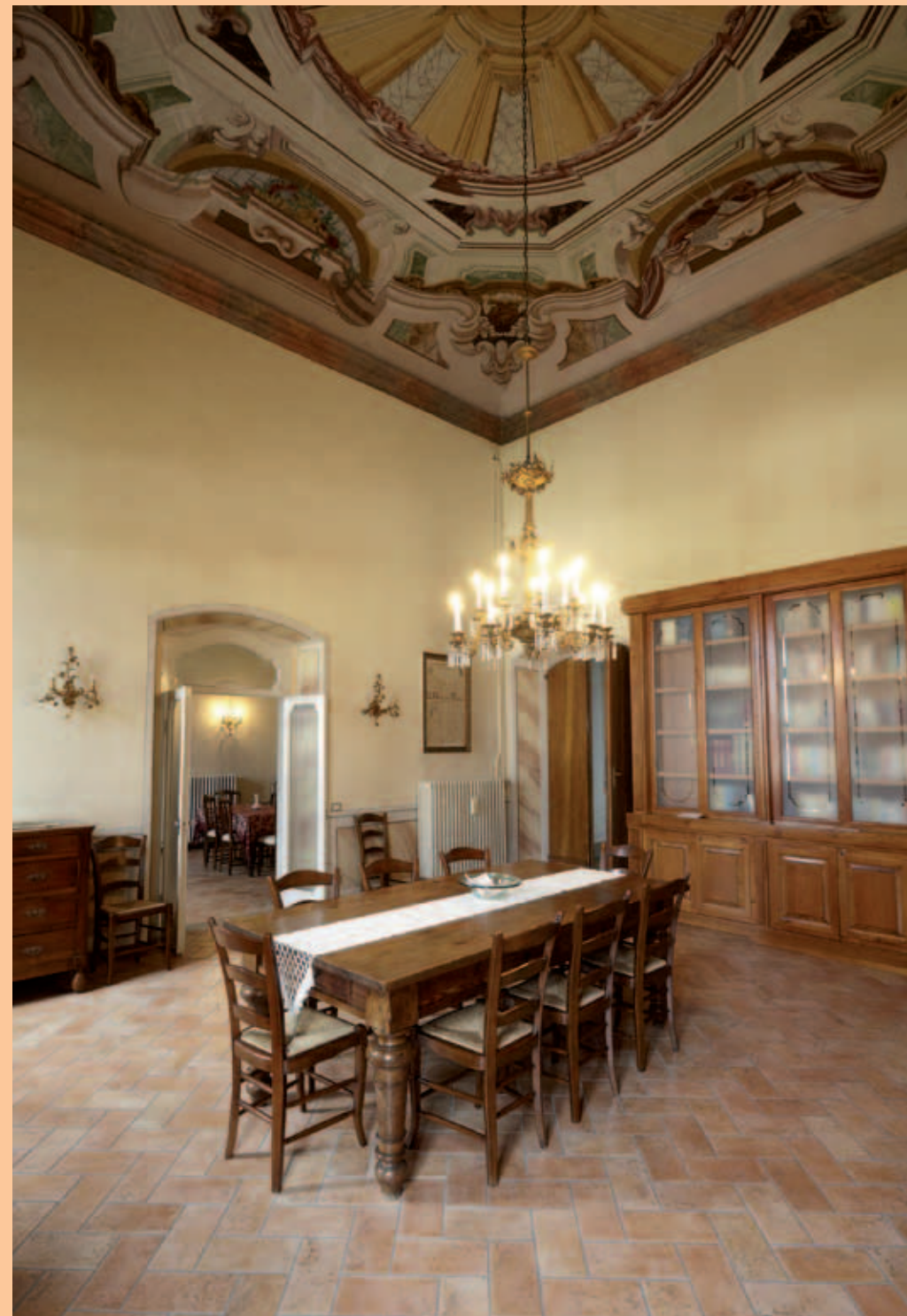
Palazzo Mazzola - particolare della Biblioteca