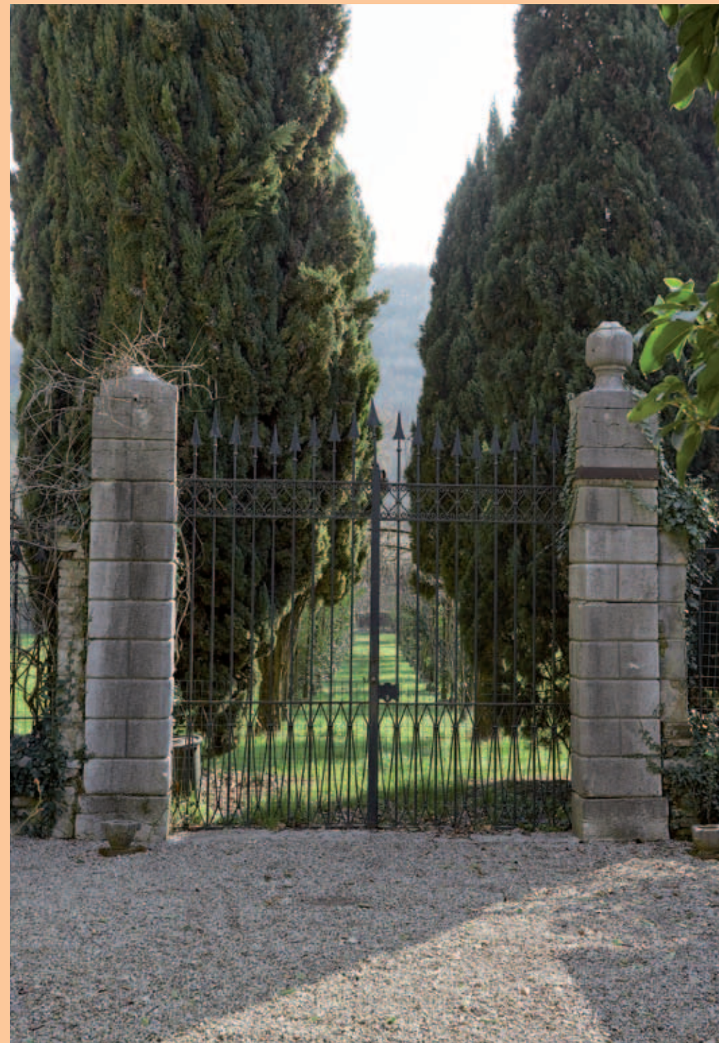
Villa Bordoni - ingresso ai terreni agricoli lato est