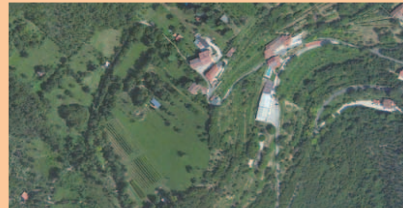
Casa Marchetti - Nicoli - vista aerea estratta da Microsoft Bing 2013

Il corpo principale della costruzione si trova ancora nelle condizioni originarie e presenta le caratteristiche tipiche dell'epoca di costruzione, mentre i corpi accessori, aggiunti tra la fine dell'800 e l'inizio del '900, sono attualmente destinati al Museo Etnografico del "Castelliere ai Cap" e ad attività connesse all'agriturismo.