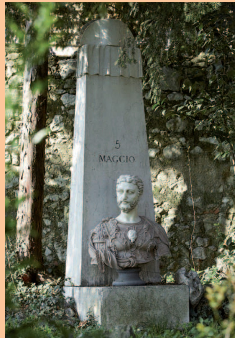
Palazzo Carini - Quecchia - Cippo dedicato alla morte di Napoleone

alberi di antico impianto (in particolare un leccio monumentale), una prospettiva con cespugli di bossi verso un'edicola contenente una statua della Madonna, un cippo in ricordo della morte di Napoleone e una piccola vasca d'acqua circolare. Degni di nota sono la torretta all'angolo nord del giardino e un cancellino che si apre nel muro di cinta con arco ad ogiva.