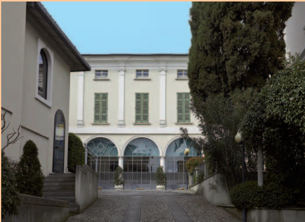
Palazzo Mazzola - vista dall'ingresso carrato

La proprietà del palazzo era della nobile famiglia Mazzola, che abitava in Brescia: era stata ascritta al patriziato nella persona di Francesco, quondam Andrea, quondam Giacomo, in data 1534. Lo stemma era così composto: "Troncato: d'azzurro e d'oro a tre mazze ferrate di nero, poste in palo sul tutto, due e uno" .