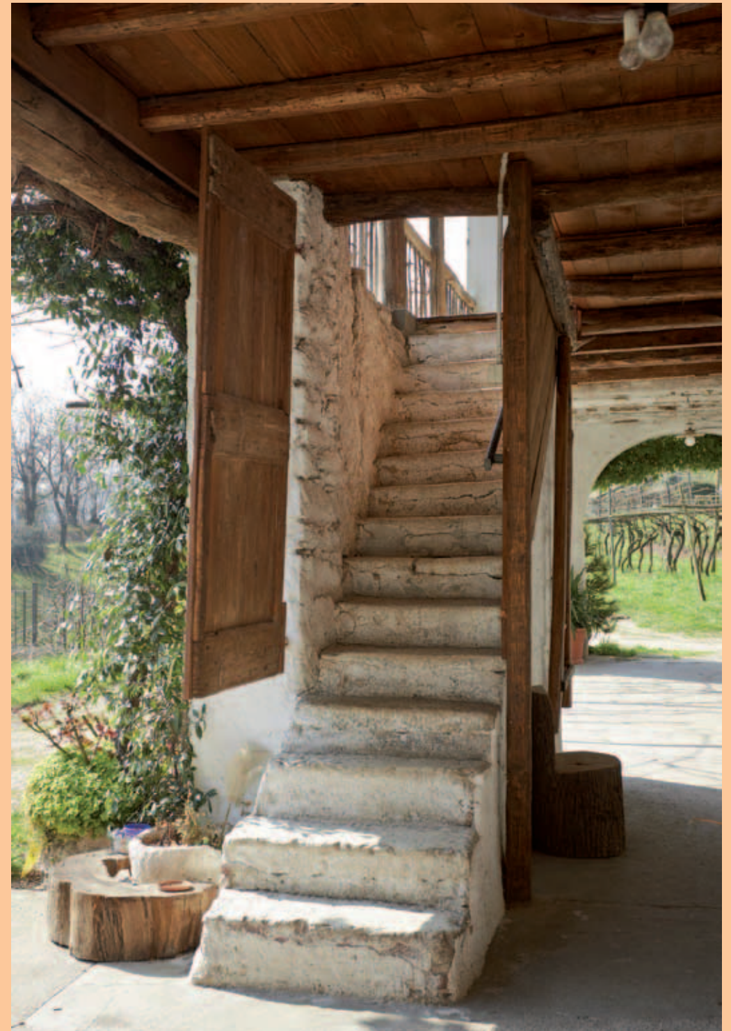
Casa alla valle del Fò - particolare interno lato ovest