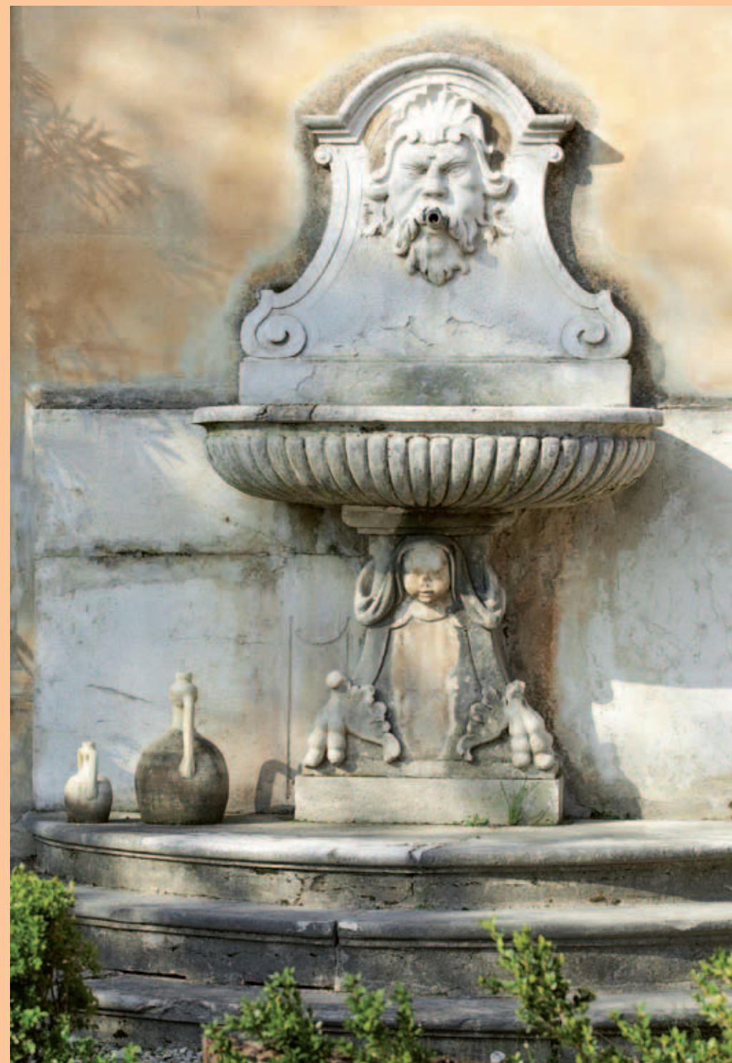
Villa Elide - particolare della fontana esterna