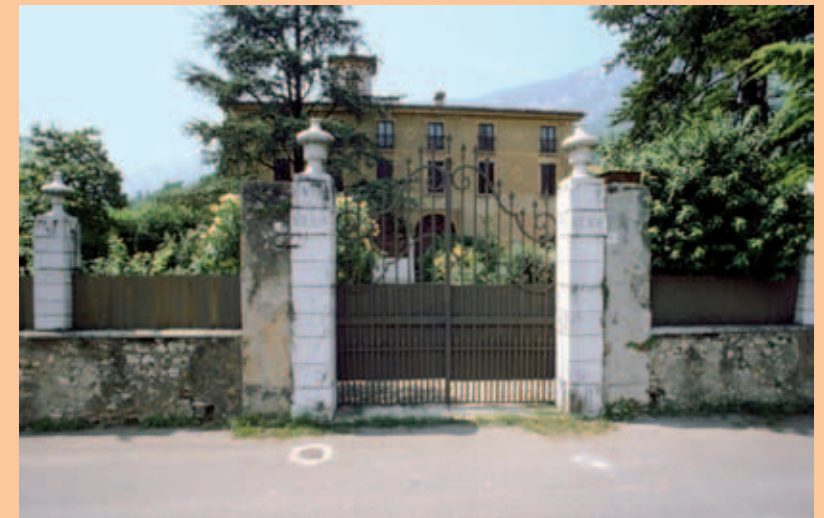
Villa Elide - cinta e cancello esterno

Villa Elide mostra la facciata sul giardino, tralasciata dal monumentale ingresso sulla Via Seminario, con imponente cancello e rustici pilastri in pietra; svolge sia un ruolo di pubblico decoro sia di vita privata. È sviluppata su tre piani. Il piano terra è costituito da un portico con quattro forni a tutto sesto sorretti da colonne in pietra di Botticino, chiusi da serramenti in ferro.