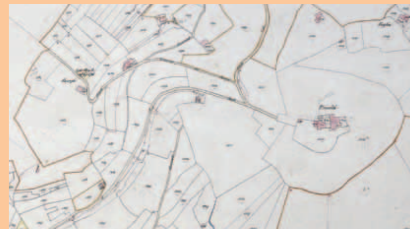
Casa Marchetti - Nicoli - estratto catasto 1845