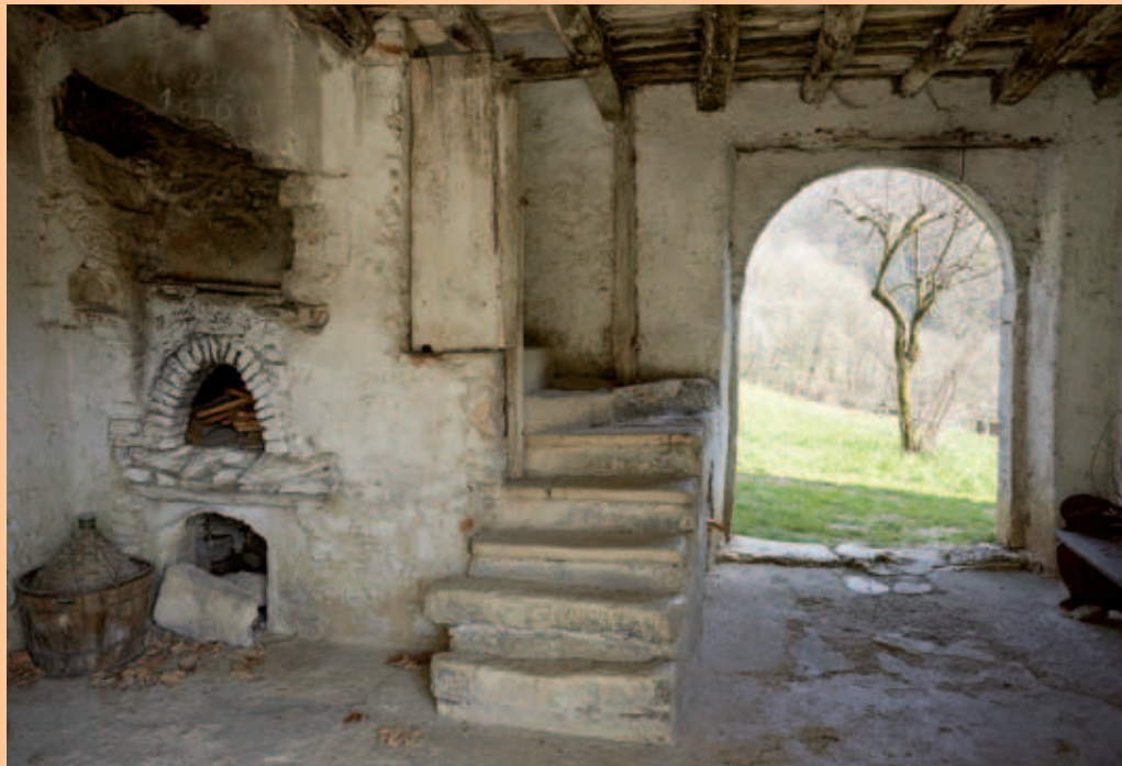
Casa alla valle del Fò - particolare interno lato nord

Alcuni storici, fra altre ipotesi, indicano questa località come il luogo nel quale sarebbe nato Arnaldo da Brescia, alla fine del sec. XI o agli inizi del XII. Chierico lettore, discepolo di Abelardo, fu canonico regolare e preposito. Morì accusato di eresia. A Brescia, a porta Venezia, gli venne eretto un monumento, inaugurato il 15 agosto 1882, a sua memoria.