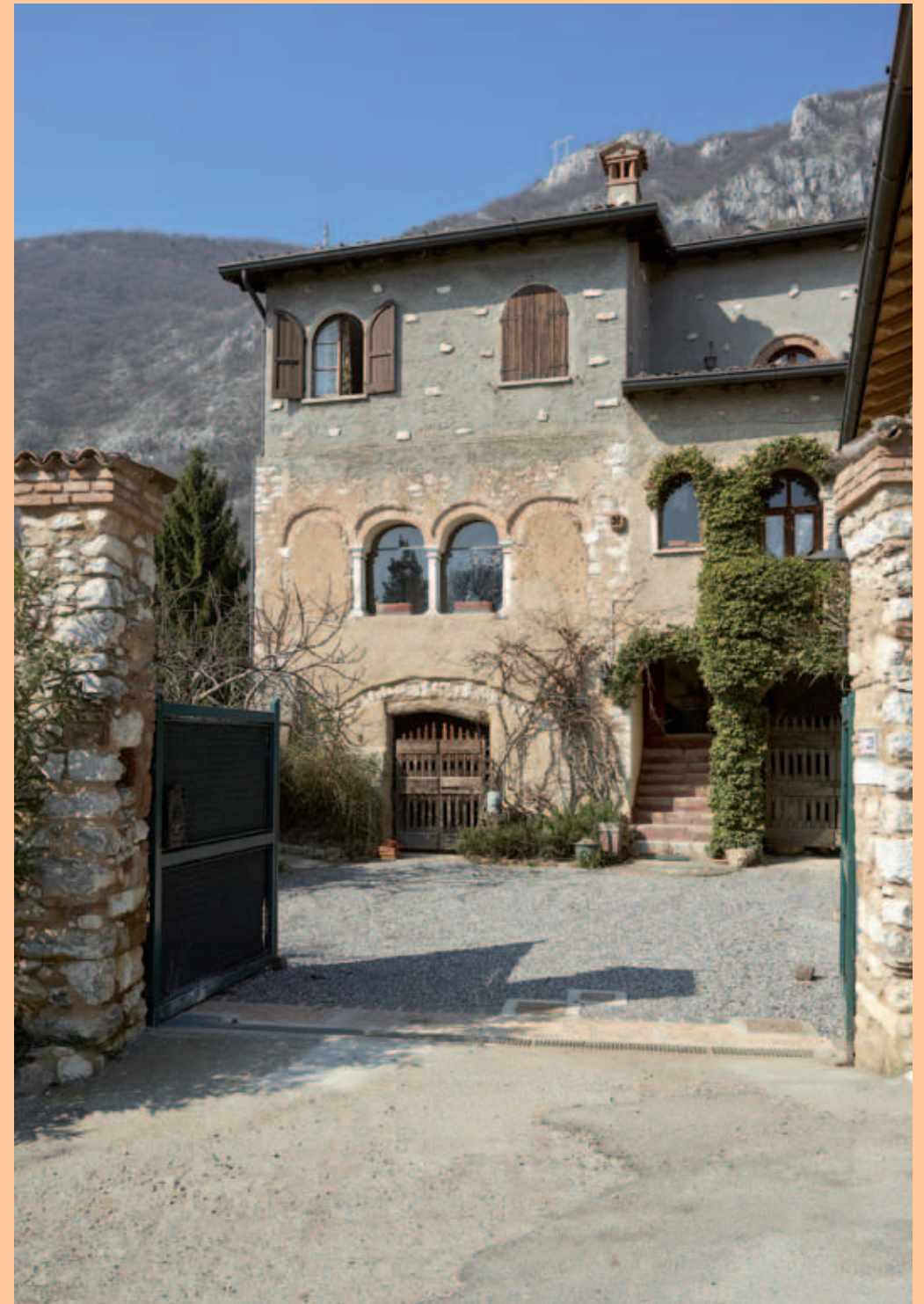
Casa Marchetti - Nicoli