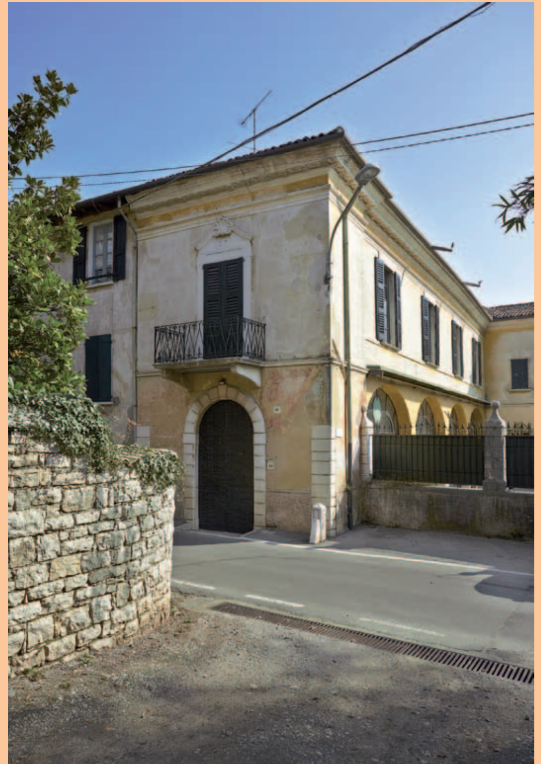
Villa Bordoni - particolare dell'ingresso pedonale in lato ovest